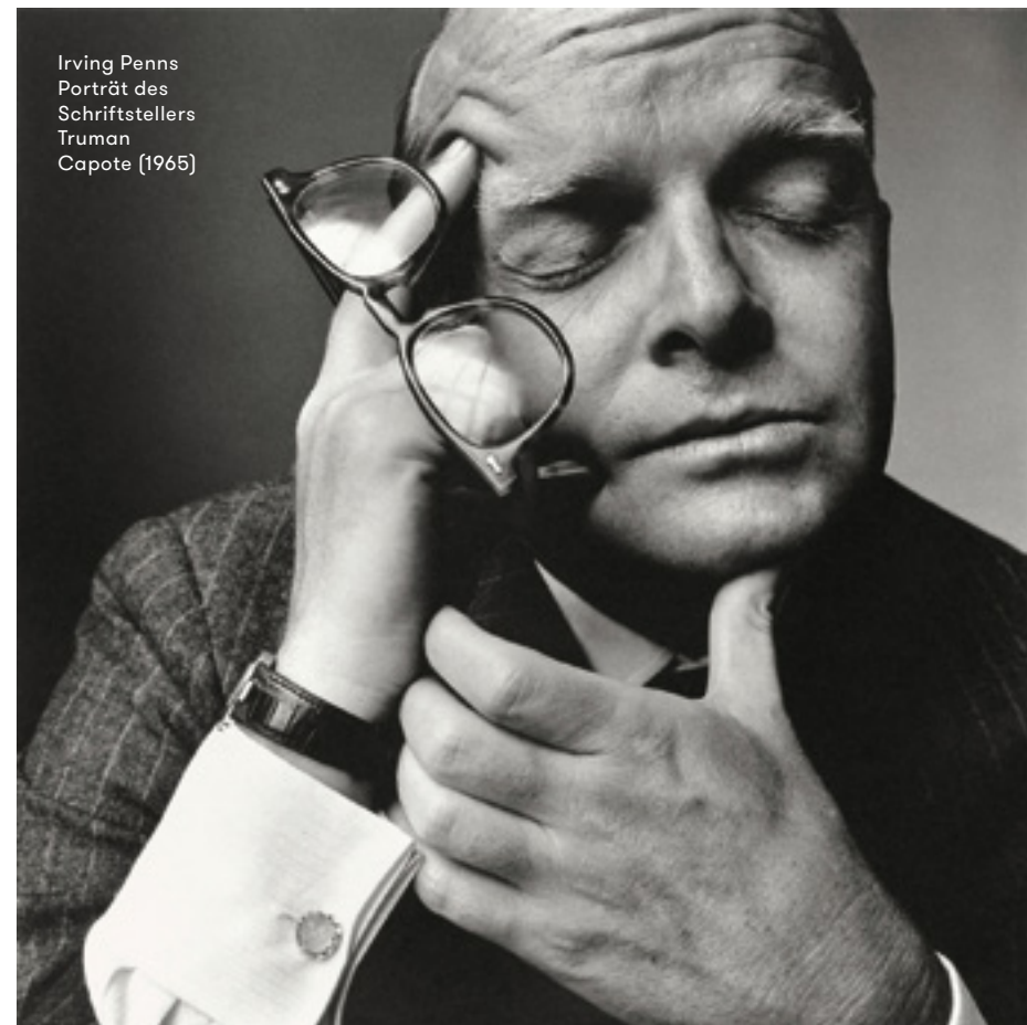
Irving Penns Porträt des Schriftstellers Truman Capote (1965)